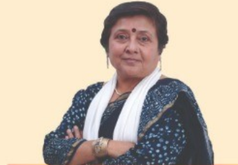
Smt. Vibhavariben Dave Hon. Minister of State (Primary & Higher Education)