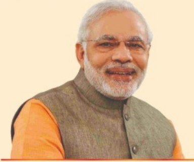
Shri Narendra Modi Hon. Prime Minister