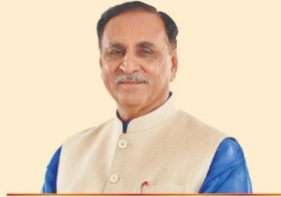
Shri Vijaybhai Rupani Hon. Chief Minister, Gujarat State