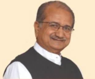
Shri Bhupendrasinh Chudasama Hon. Education Minister, Gujarat State